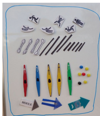
[dessin Véronique Olivier]